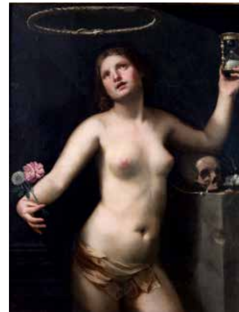
Guido Cagnacci (Santarcangelo di Romagna, 1601 - Vienna, 1663) Allegoria del Tempo (La Vita umana)