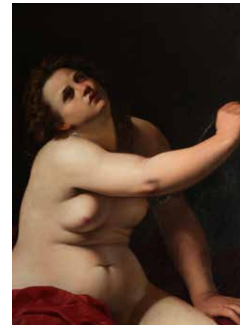
Artemisia Gentileschi (Roma, 1593 - Napoli, 1652/1653) Cleopatra

L'affascinante sede della mostra, l'imponente Palazzo Campana, è emblema della storia di Osimo. Anticamente di proprietà della nobile famiglia Campana, oggi è sede dell'Istituto per l'Istruzione Permanente, del museo civico e della biblioteca dove sono conservati oltre 15000 volumi di carattere storico, letterario, filosofico, giuridico, medico. La città di Osimo, splendida nel centro storico, nell'intreccio delle sue grotte e nella suggestione paesaggistica d'intorno, offrirà una visita inaspettata a chi verrà alla mostra. L'itinerario nel territorio potrà essere esteso da Camerano nel cuore del Parco del Conero, alle vicine città di Loreto e di Recanati sino a Jesi: alla scoperta delle meraviglie che hanno fatto delle Marche una regione ricca di arte e cultura, nella quale il rispetto e la tutela per il proprio territorio si esprime anche nella ricchezza della sua enogastronomia e nell'irresistibile fascino delle sue bellezze naturali.